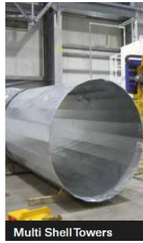
Multi Shell Towers