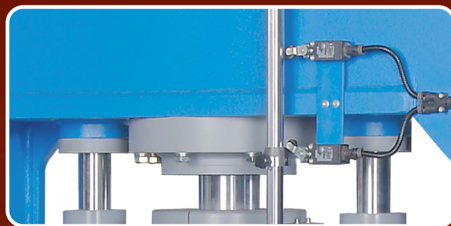
MICRONS DI ARRESTO microns for up/downstroke stop • microns de butée montée/descente Mikrons des auf/ab Haltes • micro de parada subida/bajada