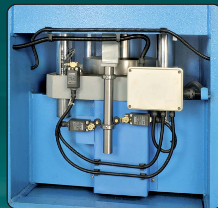
Premilamiera, Serre-tôle, Blank-holder, Blechhalter, Cojín