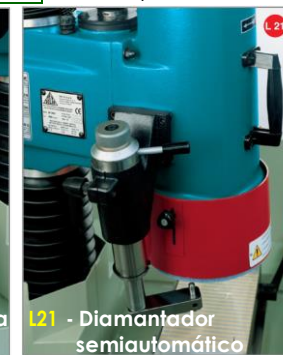
L21 - Diamantador semiautomático

A DELTA foi fundada em 1955 nos arredores de Milão, maior centro industrial da Itália.