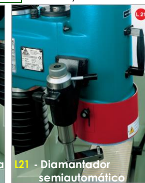
L21 - Diamantador semiautomático

A DELTA foi fundada em 1955 nos arredores de Milão, maior centro industrial da Itália.