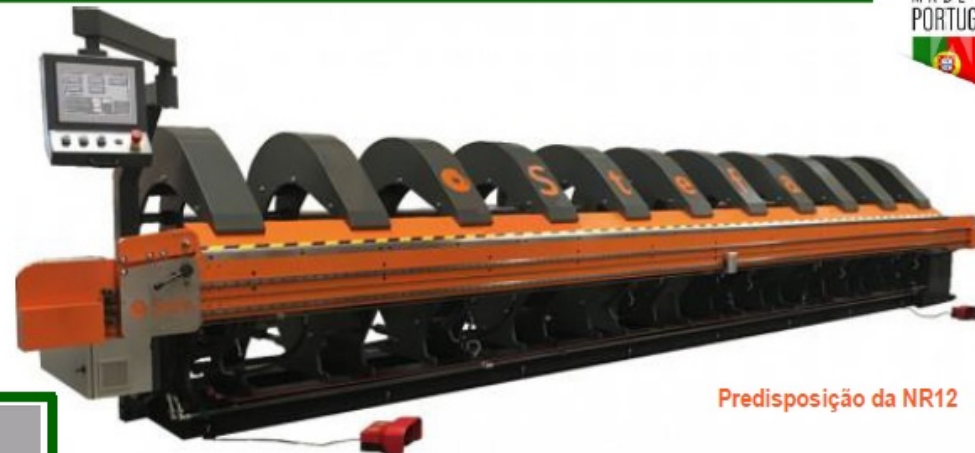
Predisposição da NR12

Cortar. Prensar. Virar. Dobrar. Virar. Cortar.