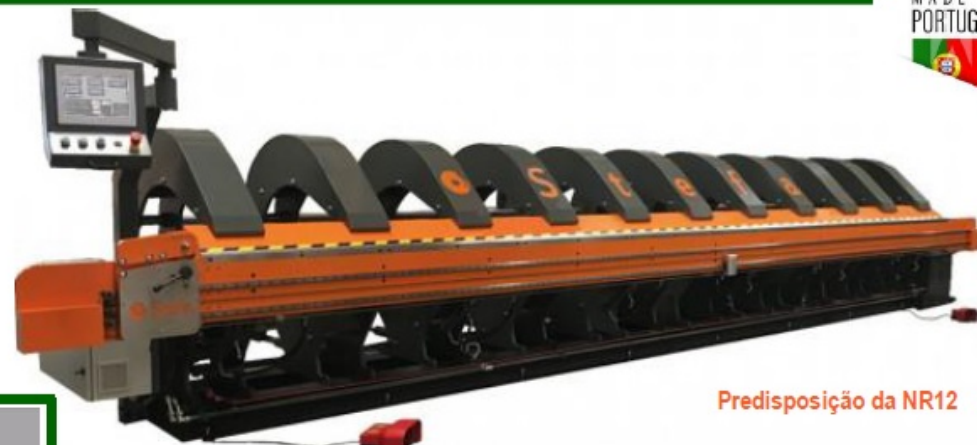
Predisposição da NR12

É guiada por duas guias lineares anexadas ao avental para assegurar estabilidade nas operações de corte.