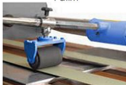
Roda de contraste