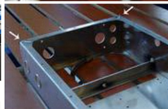
Exemplos de aplicações