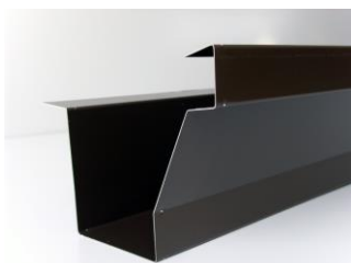
Exemplo de produto

Mesa posterior motorizada controlada por CNC de 2 eixos → X - R