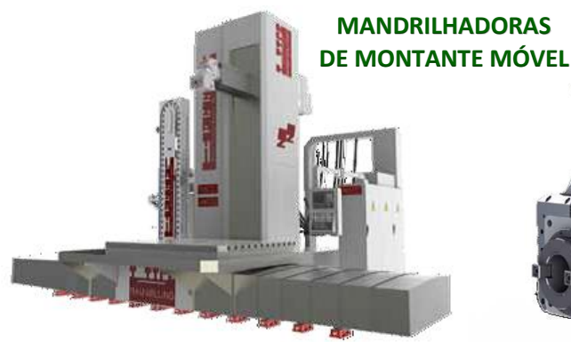
MANDRILHADORAS DE MONTANTE MÓVEL