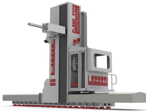
MANDRILHADORAS DE MONTANTE MÓVEL