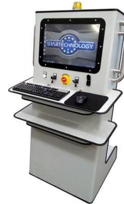
PC - B&R SP COMPACT

Diversos videoclipes deste modelo disponíveis pelo YouTube