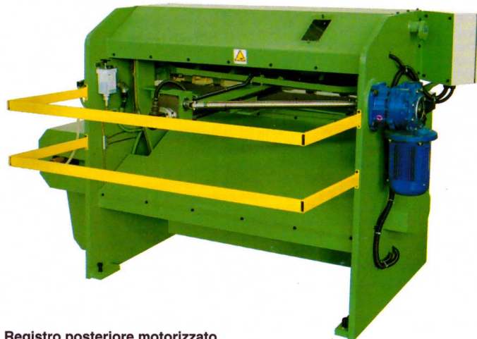
Registro posteriore motorizzato (optional)

Sonderzubehör: Möglichkeit des motorischen Antriebes des hinteren Anschlages mit Ablesung der Verfahrbewegungen an der Vorderseite - Beleuchtung der Schneidkante.